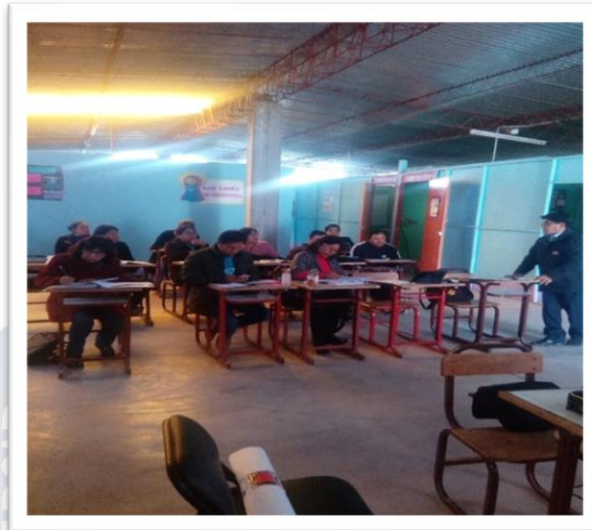
Personal docente analizando y desarrollando los Estándares del aplicativo del Sineace para identificar la problemática de la I.E. que sirvió de insumo para el Plan de acción