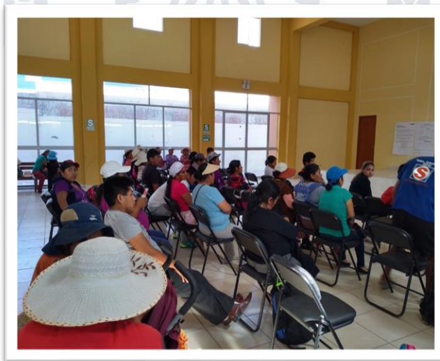
Padres de familia de la I.E. informándose sobre los resultados del diagnóstico-aplicativo del Sineace que sirvió de insumo para el Plan de acción