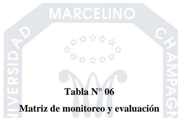
Tabla N° 06