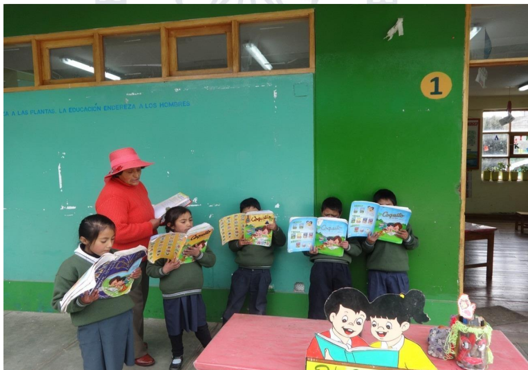
Docentes, padres de familia y estudiantes en plena ejecución de la hora de la lectura.