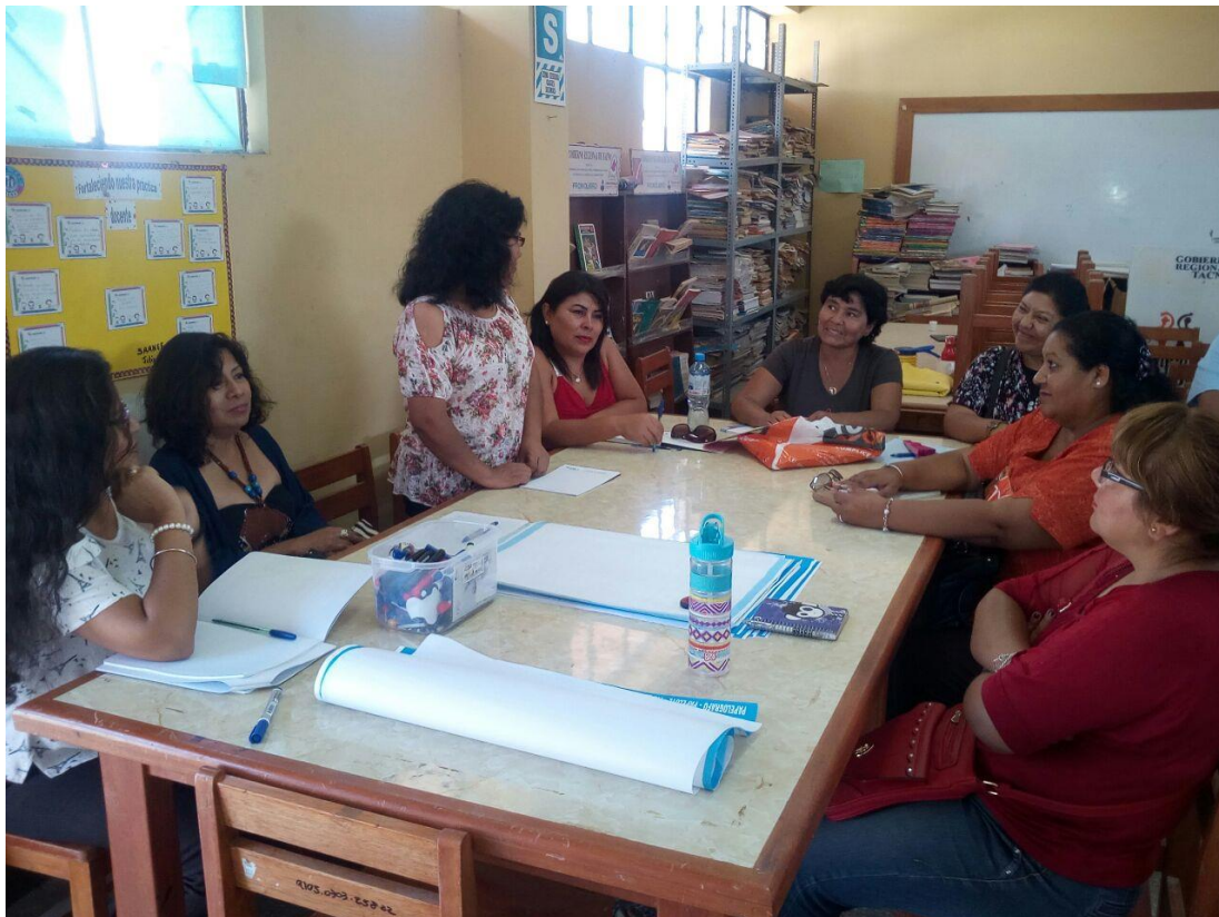
Aplicación de instrumentos a docentes